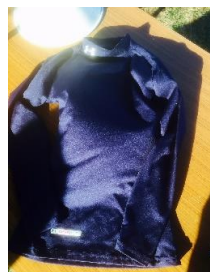
アンダーアーマ社製 子供用アンダーウェア 紺色