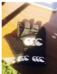
カンタベリー社製 グローブ黒 (右手のみ)