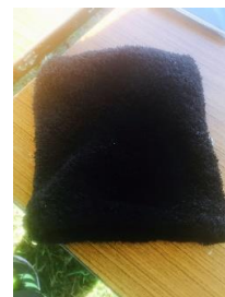
大人用ネックフーナー 黒色