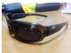
大人用 スポーツサングラス 黒色