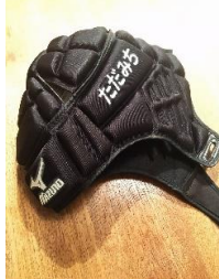
ミズノ社製 ヘッドギヤー 黒色 *名前入り 「ただみち」